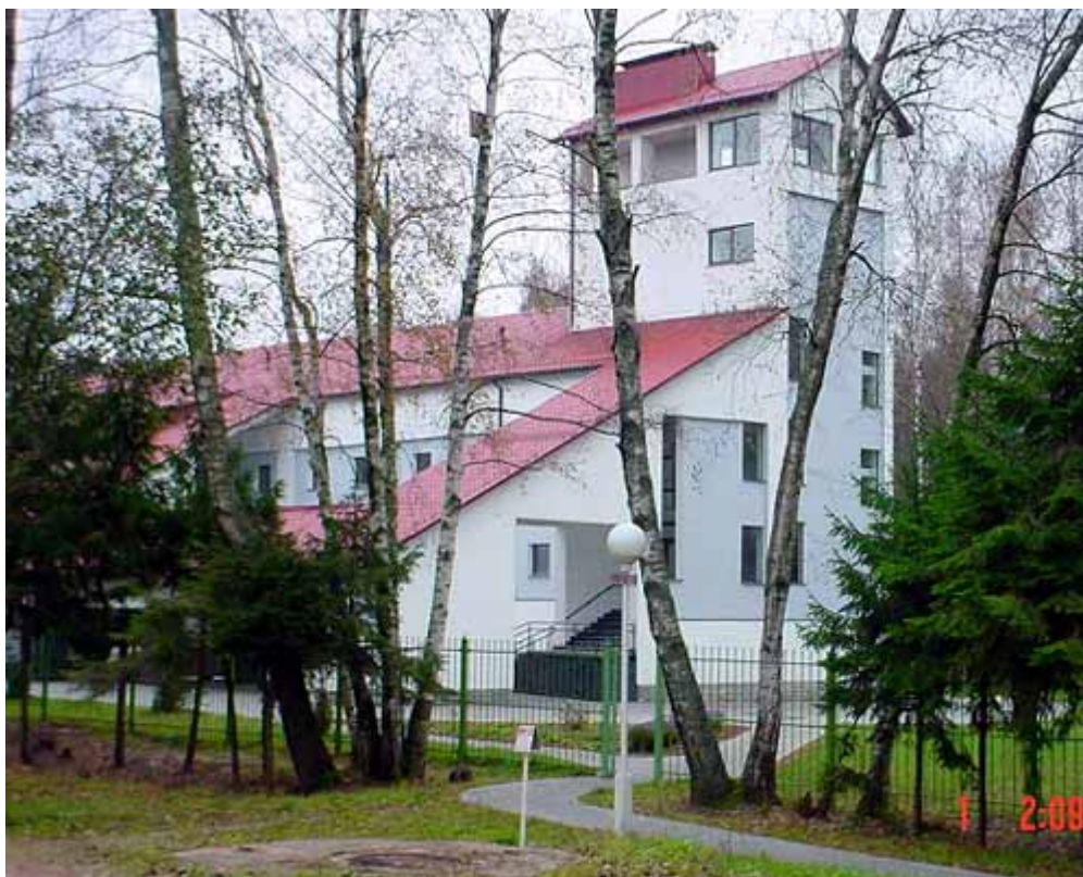
Корпус Учебно-научного центра "Нарочанская биологическая станция" БГУ

Особое место в деятельности лаборатории занимает изучение механизмов функционирования озерных экосистем, и формирования качества вод в озерах. Основным полигоном этих исследований служат разнотипные озера Нарочанской группы. Исследования проводятся на базе Нарочанской биологической станции, которая является полевым стационаром НИЛ гидроэкологии.